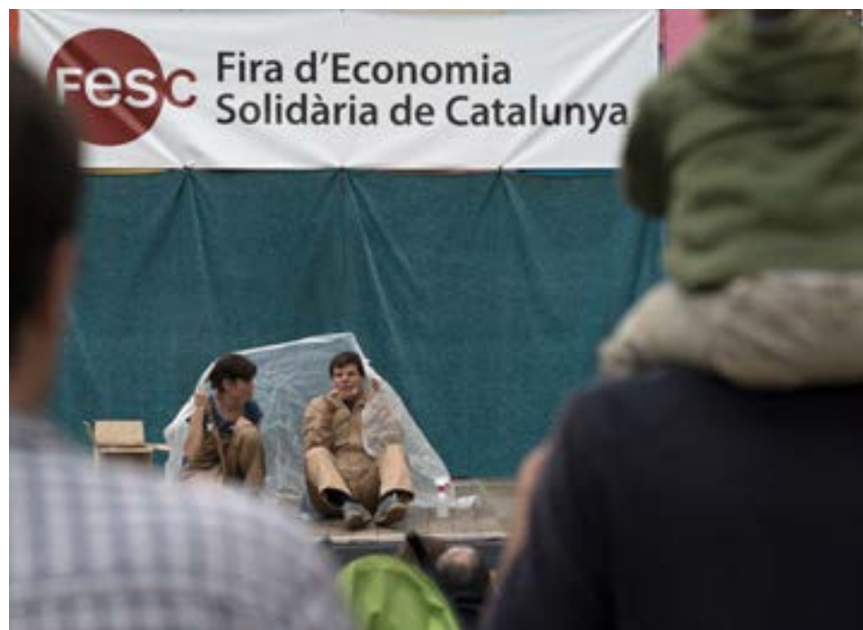
XES | Fira del 2015

Tot això i més: música, festa, intercooperació, aprenentatge... Tot el que dóna sentit a la FESC des del primer dia, ara fa cinc anys.